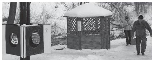
Анна Бессонова

По народному поверью считается, что родники на земле столько, сколько звезд на небе. Если парить или расквашить родник, то загадается новая звезда. По этому принципу особенно много звезд должно быть над Яковлевским районом. В 2011 году он занял второе место в областном конкурсе обустроенных родников.