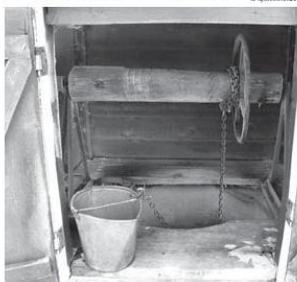
Вода из родника села Смородино вкусная и целебная

Бессонова, А. Источнику поклонись / А. Бессонова // Белгородские известия. — 2017. — 11 февраля. - № 19 — 20. — С. 3