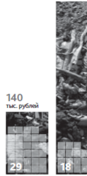
Количество выявленных свалок